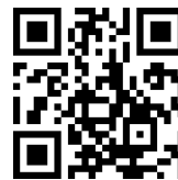
Video zum Gerät

Länge cm Breite cm Höhe cm Gewicht kg 110 105 145 250